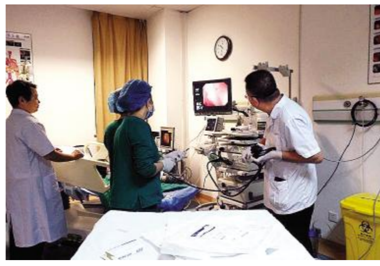
本报讯 日前,我院儿科接诊了 儿的父母发现这名2岁的幼儿大便 一名2岁的小患者,自3个月以来患 中间间断带血丝。遂行肠镜检查发现幼

儿距肛门10cm处有1枚大小约2.2cm×2.0cm息肉,诊断为幼年性直肠息肉。 经过儿科和消化内科会诊后,2月22日上午,消化内科陈正义主任为这名2岁的小患者行无痛内镜下直肠巨大息肉切除,整个手术过程顺利。 陈正义主任告诉广大患者,幼年息肉又称错构性息肉,多发生于2~10岁,男孩多见,发病率较高,约占小儿息肉中的80%,为含腺体的肉芽肿,多为良性。其发生原因可能是在过敏的基础上,硬便的损伤,慢性炎症引起。开始肠黏膜呈慢性炎性增生,逐渐增大形成1cm左右直径的息肉,多呈球形。有研究显示,小儿肠息肉主要为非肿瘤性息肉,但在小儿多发息肉中也有腺瘤性息肉发生,故对多发性息肉的患儿应加强随访。(黄晓曦)